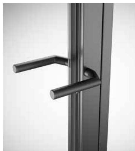
Drücker in Tiefschwarz RAL 9005