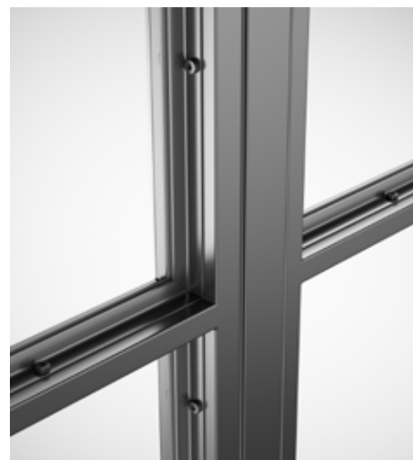
Profil mit Winkelglashalteleiste [Optional], Ansichtsbreite 50 mm