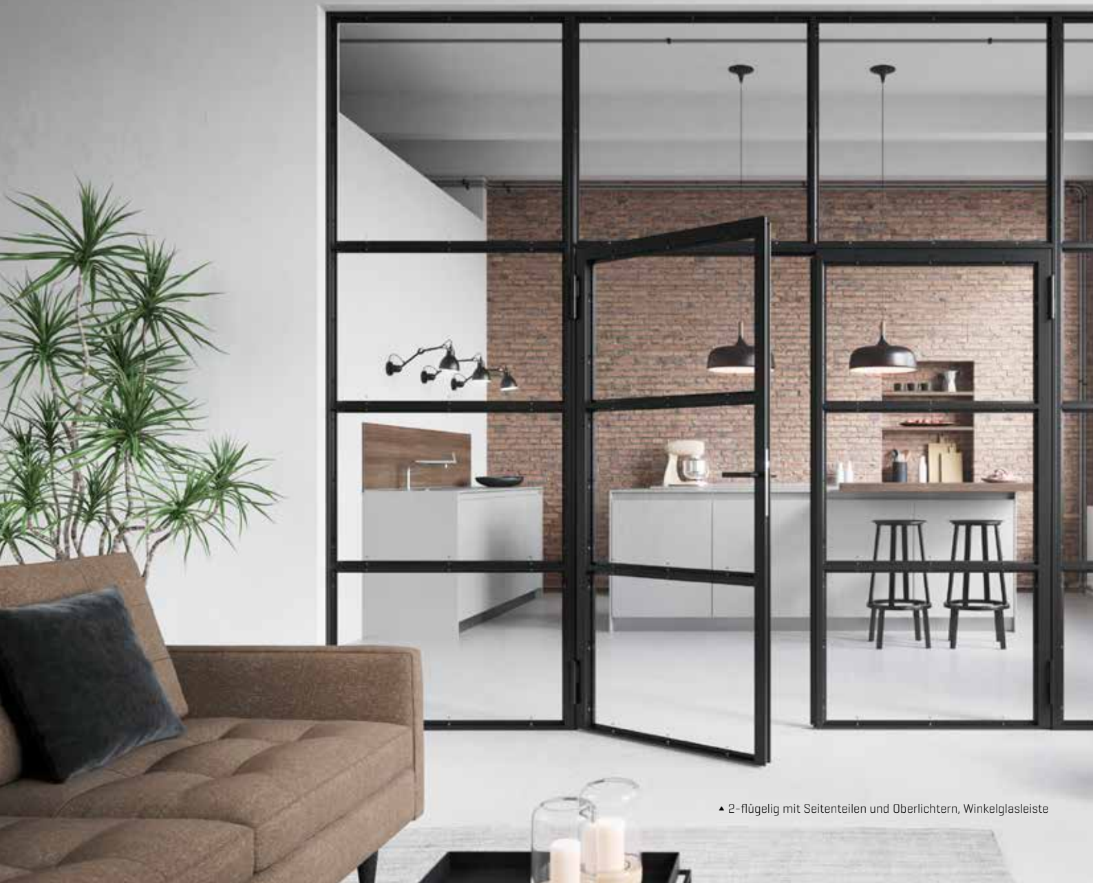
▲ 2-flügelig mit Seitenteilen und Oberlichtern, Winkelglasleiste