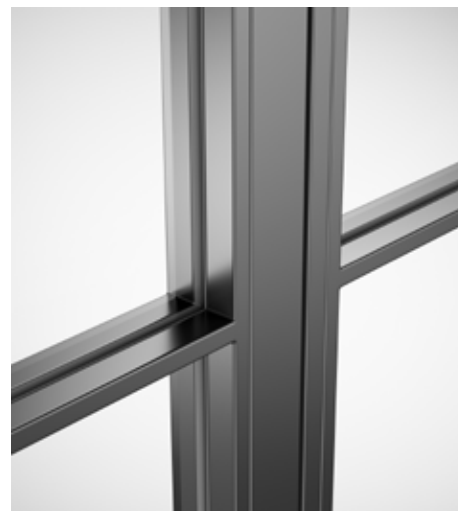
Profil mit Glashalteleiste Slim [Standard], Ansichtsbreite 15 mm

Wahlweise können Sie die Türen mit Winkelglashalteleisten oder der Glashalteleiste Slim ausstatten. Als Türbeschlag wählen Sie zwischen Tiefschwarz RAL 9005 oder Edelstahl. Mit den Lofttüren schaffen Sie eine moderne, zurückhaltende Verbindung zwischen mehreren Räumen und sorgen gleichzeitig für viel Licht. Das filigrane Stahlprofil verleiht dem Design eine moderne Linie und wirkt zugleich leicht, das Glas unterstützt diese elegante Gesamtwirkung.