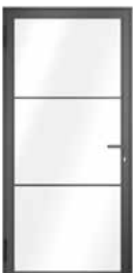
1-flügelig, Glashalteleiste Slim