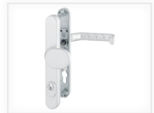
Schutzbeschlag Drückergarnitur mit Langschild und Kernziehschutz EV1