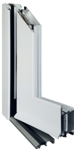
Musterecke Arcade mit Wetterschenkel