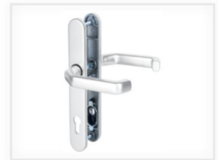
Schutzbeschlag Wechselgarnitur mit Langschild, außen Knopf abgekröpft und Kernziehschutz EV1