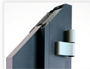
zwei zweiteilige Aufschraubbänder, dreidimensional verstellbar, EV1