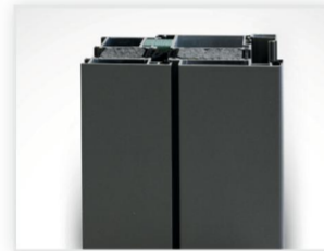
Arcade 69 mm, Türrahmen bündig mit Flügelprofil